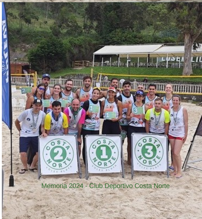
Memoria 2024 - Club Deportivo Costa Norte